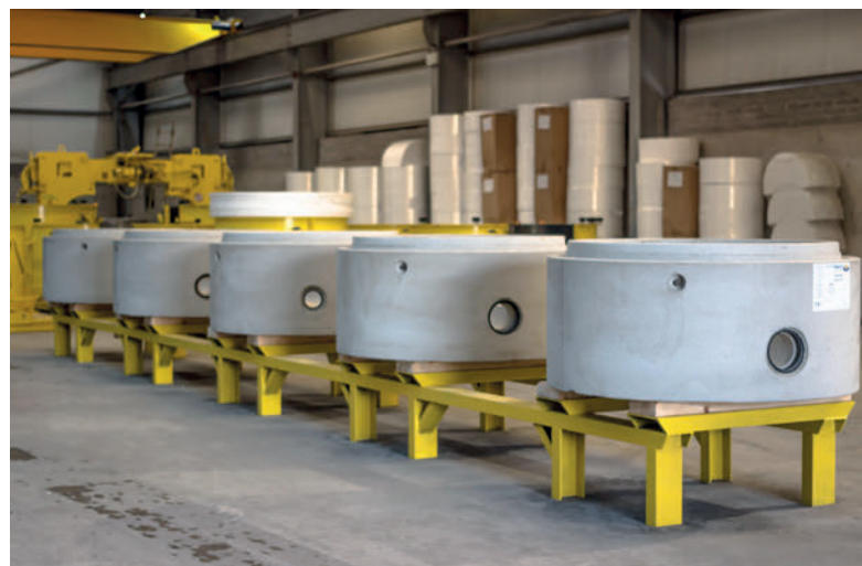
Монолитные бетонные шахтные кольца с днищами с индивидуальной конфигурацией водоводов