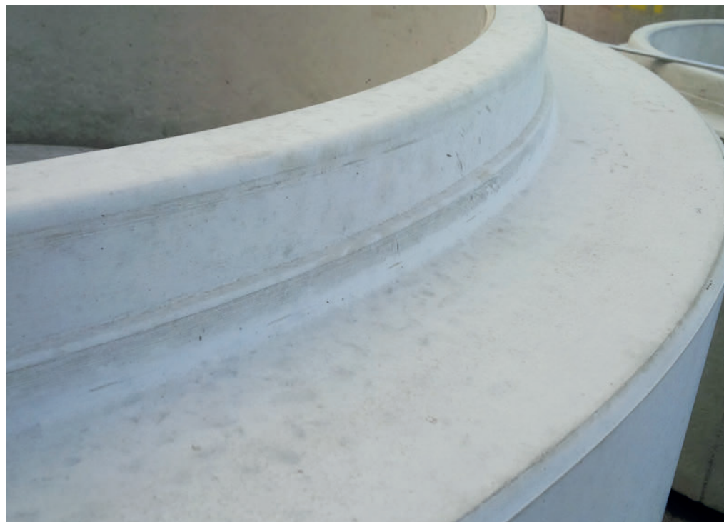
Безупречная бетонная поверхность шахтного элемента Perfect позволяет прогнозировать срок службы изделия свыше 100 лет

сред, монолитные кольца с днищами отличаются проверенной в теории и на практике высокой прочностью на сжатие и износостойкостью.