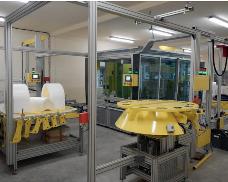
Горячепроволочные резаки с компьютерным управлением гарантируют точную резку заготовок для требуемого негатива лотка