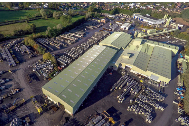
Предприятие Tracey Concrete Limited в Эннискиллене, графство Фермана, Северная Ирландия

Поставленная на завод Tracey Concrete производственная линия Perfect укомплектована дюжиной вибротельных форм для выпуска монолитных колец с днищем диаметром DN1200, DN1500 и DN1800. Монтажная высота шахтных