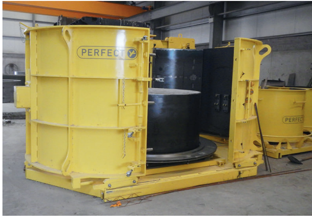
Компания Traseu Concrete выпускает индивидуальные бетонные кольца с днищами диаметром до 1800 мм при помощи пенополистироловых заготовок

Технология Perfect предусматривает использование исключительно подвижных или самоуплотняющихся бетонных смесей, твердеющих в опалубке, что гарантирует не только очень точную геометрию стыков, но и высокое качество поверхности с минимальной водопропускаемостью. Помимо высокой стойкости к воздействию химически агрессивных