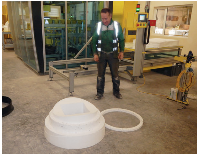
Высокоточный негативный вкладыш, изготовленный из пенополистирола

Центральным компонентом Perfect является продуманный комплект формообразующих шаблонов для водоводов. Заготовки базовых элементов из пенополистирола (EPS), включая дуги, прямые элементы или вкладыши патрубков, складываются в негатив лотка при помощи простых инструментов. Пенополистироловые заготовки разработаны таким образом, чтобы минимизировать расход материала при формовании типовых водоводов. Резка заготовок ведется при помощи резака с горячей проволокой и не составляет труда. При этом простая в использовании программа по планированию передает все данные по конфигурации кольца с днищем на резаки.